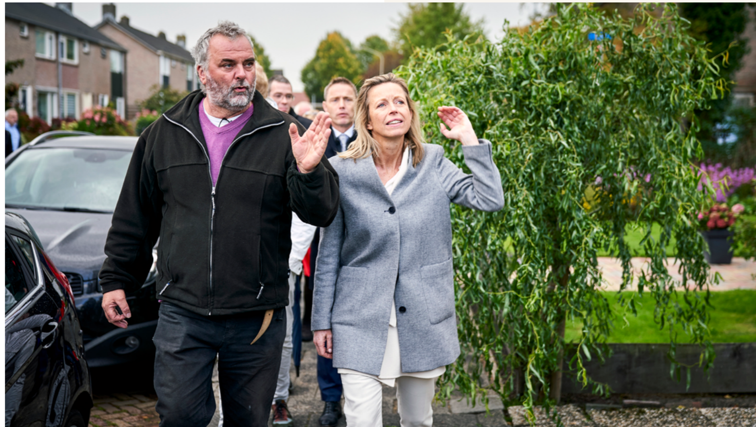
Minister Ollongren bezoekt Assen waar de wijk Lariks voorbereid wordt op een aardgasvrije toekomst.

“De gemeente heeft de plicht om iedere bewoner een goed alternatief te bieden. Maar de bewoners zullen het uiteindelijk moeten doen.”